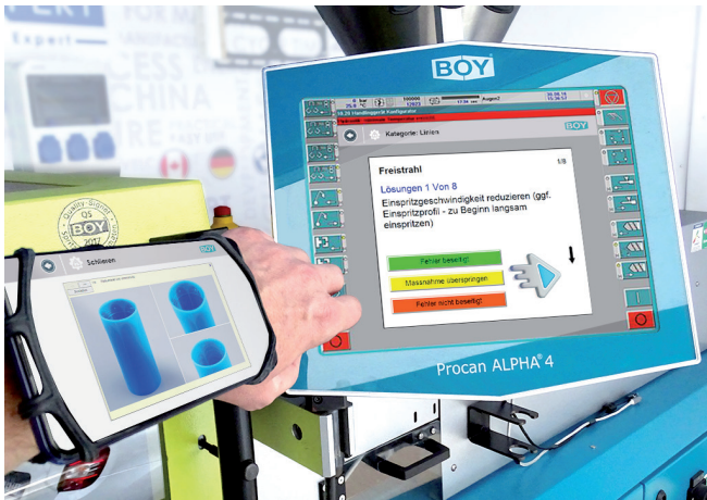
Der Moulding Assist visualisiert mögliche Lösungsschritte

Mit diesem intelligenten Assistenten können aufgetretene Spritzgießfehler identifiziert und beseitigt werden. Der digitale Helfer liefert dem Anwender direkt an der Spritzgießmaschine Lösungsvorschläge zur Beseitigung der Spritzgießfehler.