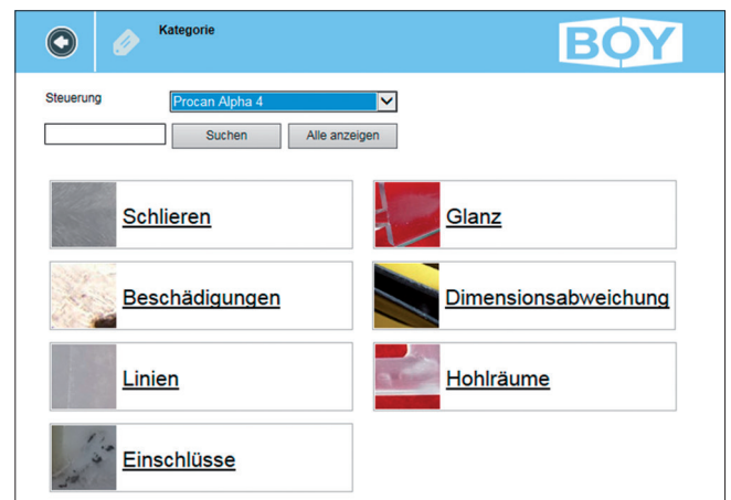
Ein Tastendruck und die Startseite des Assistenten öffnet sich: Hier werden mögliche Spritzgießfehler in einzelnen Kategorien zusammengefasst.

Nach Erweiterung der Alpha 4 um ein optionales Edge Device lässt sich über den Web-Browser direkt an der Maschinensteuerung nicht nur der Moulding Assist aufrufen, sondern auch die BOY-Homepage mit der hilfreichen BOY-App mit Kühlzeit- und Schließkraftberechnungen sowie Tabellen mit Verarbeitungsdaten zu vielen Kunststoffen nutzen. Auf dem Edge Device gespeicherte Dokumente, z.B. das komplette Bedienhandbuch, können direkt an der Maschinensteuerung angezeigt werden.