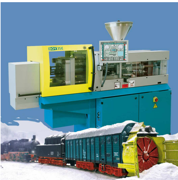
Foto(s): > BOY 35 in der Märklin-Produktionshalle BOY 35 E und Märklin-Modelleisenbahn