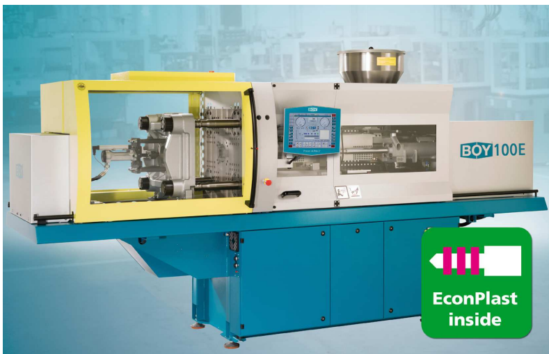
Foto(s): > Balkengrafik Energieeinsparung durch EconPlast BOY 100 E mit EconPlast inside